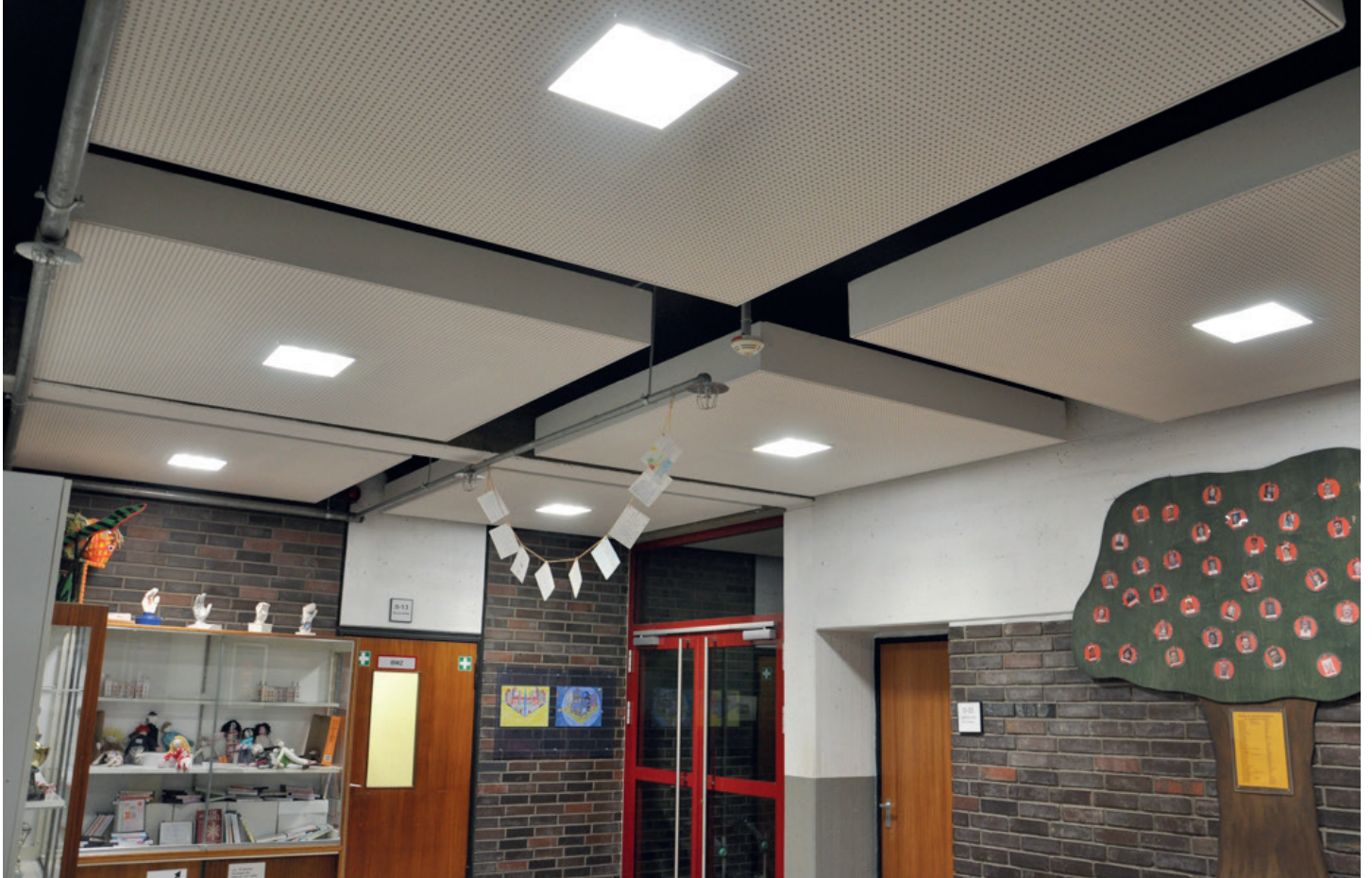
Realschule Viersen: Einbauleuchte ESL in abgehängter Decke