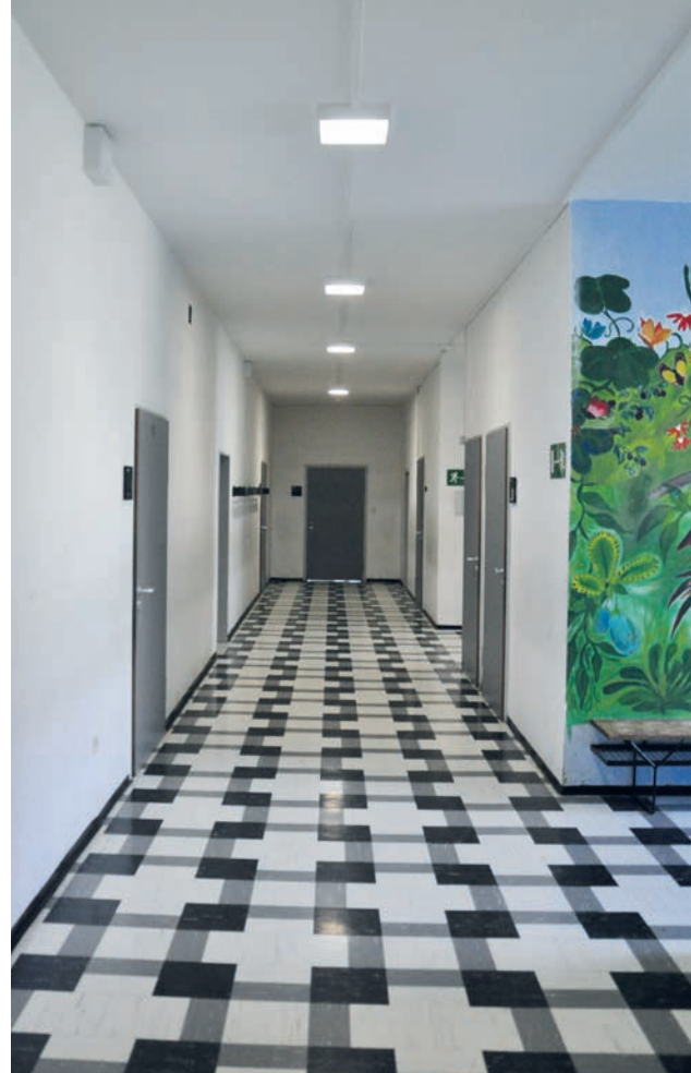
Flur in Realschule Wolfratshausen mit ASL