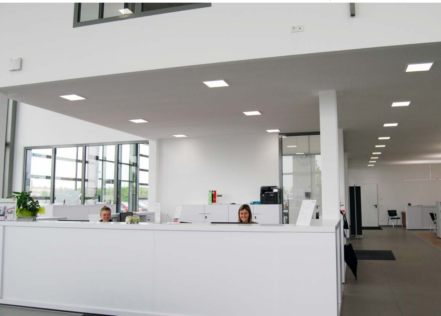
Cool und modern: ESL Einbauleuchte im Foyer/Showroom eines Autohauses (s. auch Titelseite)