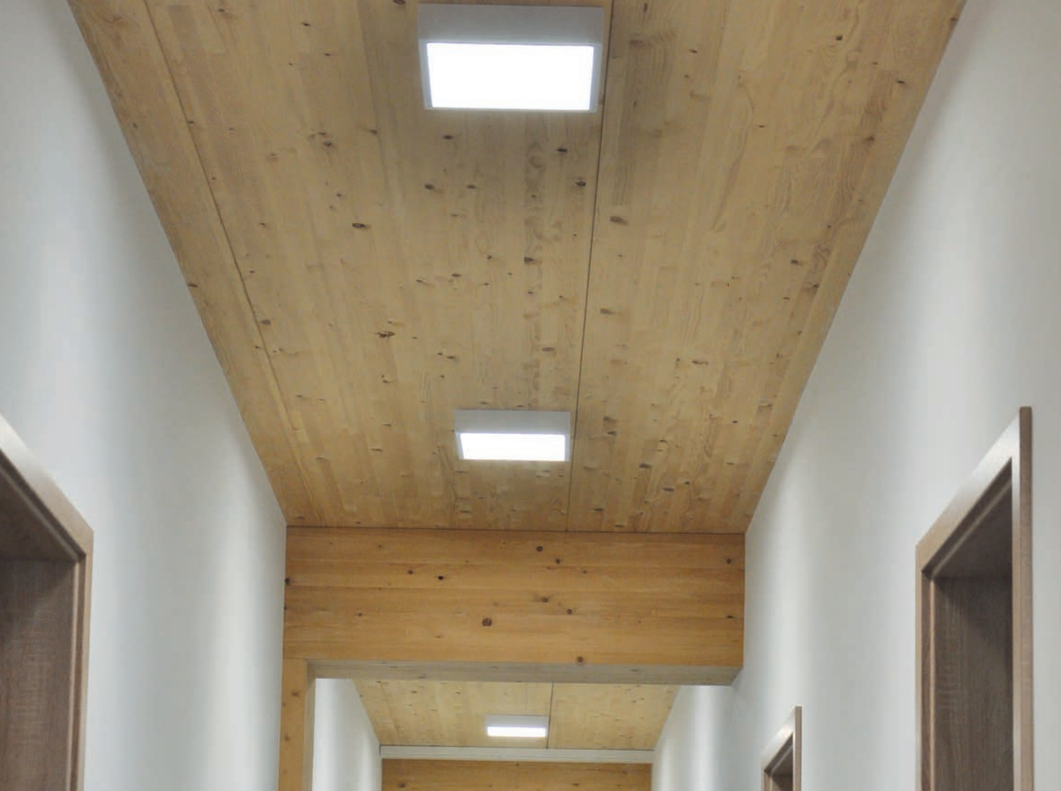
Rustikales Ambiente: ASL Anbauleuchte an Holzdecke