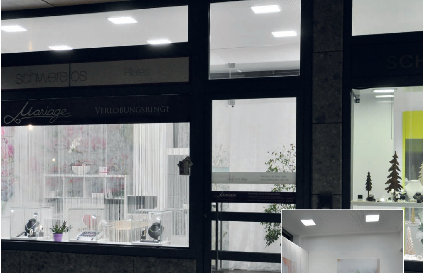
Einbauleuchte ESL schafft traute Atmosphäre in Trauringstudio